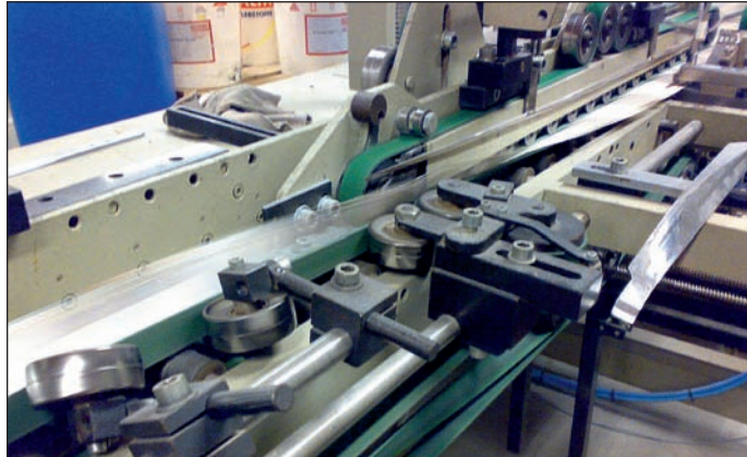
De vouwplakmachines zijn voorzien van de nieuwste lijmaaldetectie.

Vermijs Kartonnage in Oosterhout, specialist in kleine en middelgrote oplagen vouwkartonnage voor met name de farmaceutische industrie, werkt nauw samen met Nordson, wereldwijd marktleider in belijming. Het resultaat is een hoge kwaliteit en een minimale productuitval.