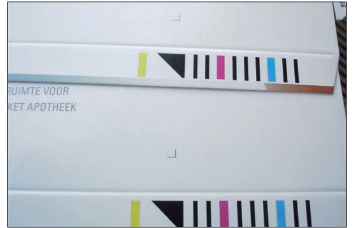
De kleurcode geeft een verpakking een uniek ID-nummer dat wordt gecontroleerd door apparatuur van Nordson.

De rol van de operator blijft belangrijk. Die moet het systeem kalibreren. Op het moment dat de belijming perfect is, worden de instellingen vastgelegd als standaardinstelling voor de betreffende order. Een belangrijk aandachtspunt voor Vermijs en andere vouwkartonnagebedrijven zijn de zogeheten 'binnenplakkers', de doosjes die door slechte belijming aan de binnenzijde kleven.